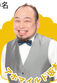
アホマイルド坂本