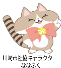
川崎市社協キャラクター ななぶく