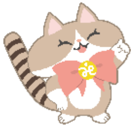
川崎市社協キャラクター ななふく