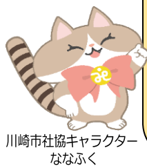
川崎市社協キャラクター ななぶく