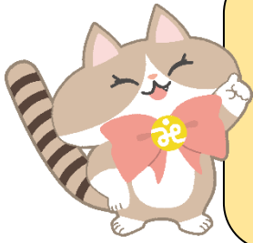
川崎市社協キャラクター ななぶく