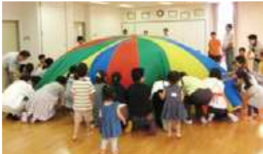
子育てサロンの開催