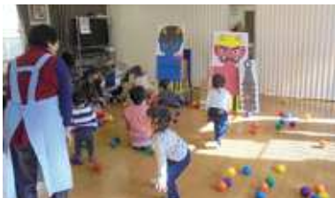
多世代交流・居場所の運営