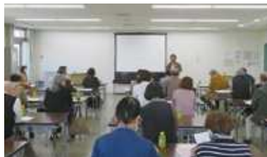
ボランティア講座の開催